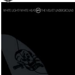
White light/white heat, 2ème album

Voir la musique du Velvet Underground dans le catalogue des médiathèques