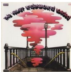
Loaded, 4ème album avant le départ de Lou Reed