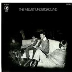
The Velvet Undetground, 3ème album