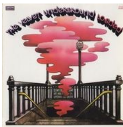
Loaded, 4ème album avant le départ de Lou Reed