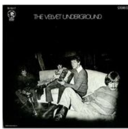
The Velvet Undetground, 3ème album