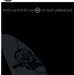
White light/white heat, 2ème album

Voir la musique du Velvet Underground dans le catalogue des médiathèques